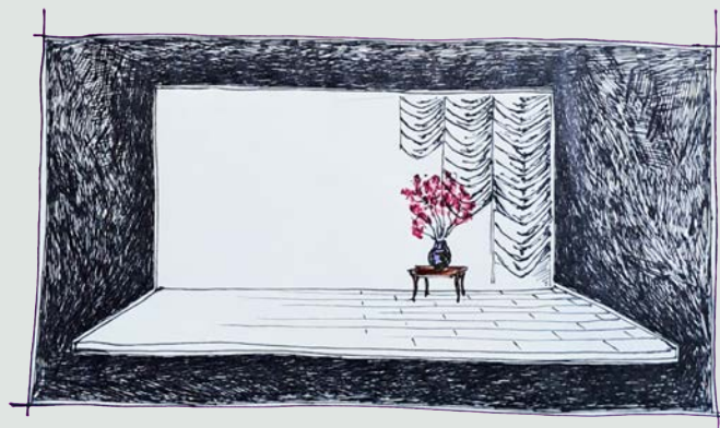
© Ebauches de scénographie par François Gauthier-Lafaye