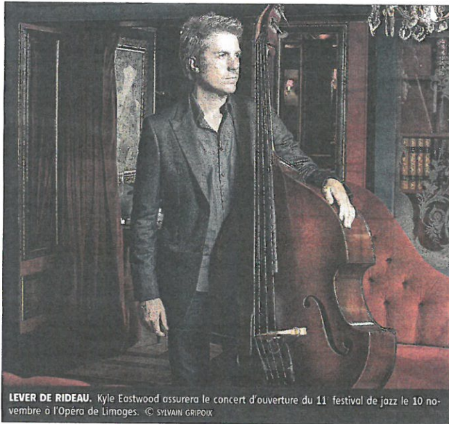
LEVER DE RIDEAU. Kyle Eastwood assurera le concert d'ouverture du 11 e festival de jazz le 10 novembre à l'Opéra de Limoges.

Du blues aussi. À cette liste prestigieuse s'ajoute l'harmoniciste Matthew Skoller. Venu tout droit de Chicago il apportera