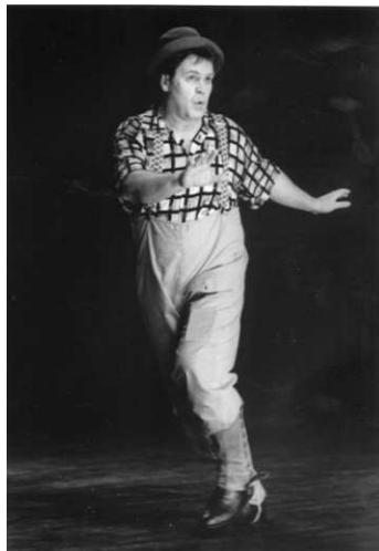
La Patrouille du conte