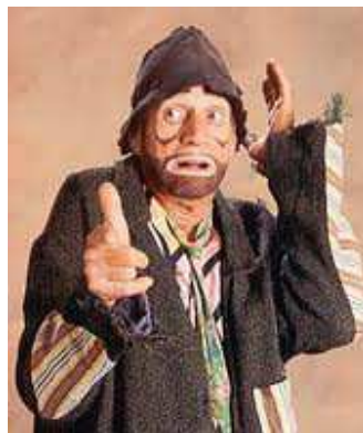
Le Clown Sol

Le projet de spectacle en hommage au Clown Sol, alias Marc FAVREAU, est né d'une rencontre il y a plus de trente ans. Pour ce qui me concerne j'étais déjà amoureux des mots et des sens cachés qu'ils révélaient à partir de leur juxtaposition ou de leur distorsion. Raymond Devos les avait conduits à une folle poésie de l'absurde. Le Clown Sol apporte sa touche de malice, de fantaisie et de philosophie. Il y ajoute même un nuage de critique sociale, non revendiquée ouvertement mais qui apparaît en filigrane, ne serait-ce que dans la touchante humanité de son personnage de clown clochard